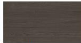
Piment Esche Allspice Ash Piment Essen