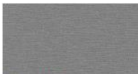
Alu Geschliffen Aluminium Polished Geslepen Aluminium