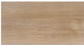
Toskanischer Nussbaum Tuscan Walnut Toskaans Noten