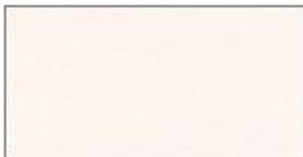
Weiß Struktur White Structure Wit Structuur