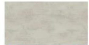
Alabaster 19 mm