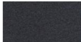
Anthrazit Struktur Anthracite Structure Antraciet Structuur RAL 7016