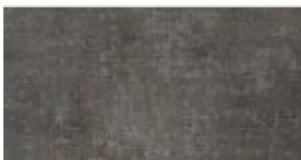
Altes Eisen 19 mm Old Metal Oud Metaal