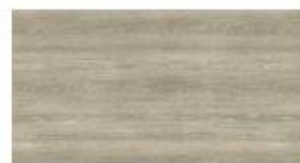
Candis Eiche Rock Sugar Oak Candis Eiken