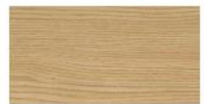
Eiche Natur Natural Oak Eiken Natuur