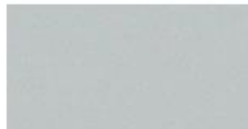
Weißaluminium White Aluminium Wit Aluminium RAL 9006