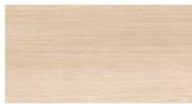
Akazie Acacia Acacia