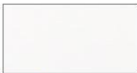
Superweiß Super White Superwit