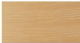
Buche Gedämpft Beech Muted Gedempt Beuken