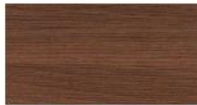
Nussbaum Natur Natural Walnut Noten Natuur