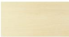
Ahorn Maple Ahorn

Dekore · Decors · Decors Melamin-Spanplatte 19/25 mm und MDF 19 mm · MDF and Particleboard · MDF en Spaanplaat