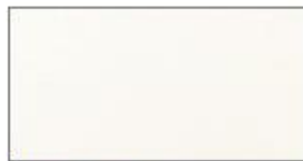
Porzellanweiß Porcelain White Porseleinwit