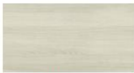
Crema Buche Crema Beech Crema Beuken