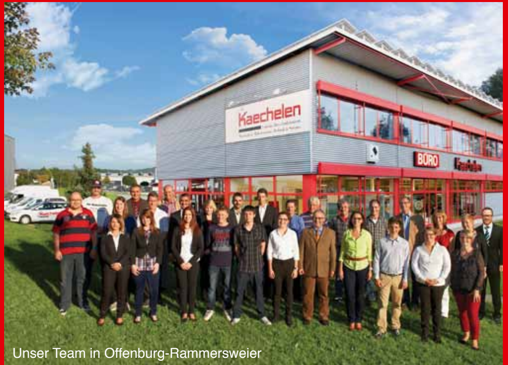
Unser Team in Offenburg-Rammersweier

Überzeugend schnelle Bestellwege garantieren Ihnen einen preiswerten Einkauf. Wählen Sie einfach aus unseren Katalogen Ihre gewünschten Artikel und bestellen Sie bequem per Telefon, Fax oder direkt im Online-Shop. Selbstverständlich freuen wir uns auch über Ihren persönlichen Einkauf in unserem gut sortierten Fachmarkt mit Papeterie und Geschenkartikeln: Bei uns werden Sie sicher fündig.